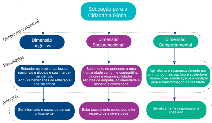
Figura 1 – Educação para a Cidadania Global

Por sua vez, estes resultados de aprendizagem norteiam os atributos necessários para o desenvolvimento da cidadania global. Os atributos referem-se às características e às qualidades desenvolvidas pela ECG (UNESCO, 2016).